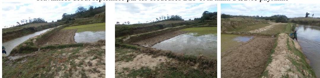
En septembre 2015 mise en eau par main d'œuvre locale et repiquage du riz semé auparavant

LE PROJET CHARRETE RURALE TRADITIONNELLE , construite sur place, pour le lieu Ivntsoa centralisant les élevages gérés par les jeunes. Elle sert aux récoltes de riz, de fumier, de matériaux et .... Au transport des plus petits enfants des colonies de vacances Bsf proche.