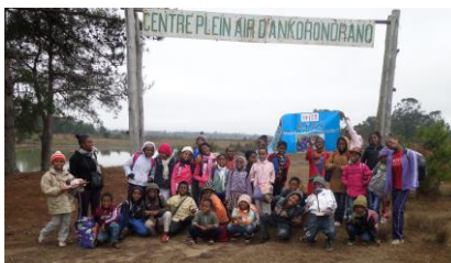
L'opération sandwich pour partir en colo - L'Association en colonie de vacances