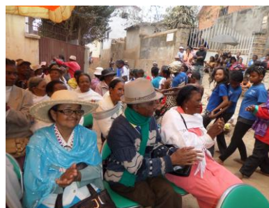
L'Association lors de la Journée Bleue.