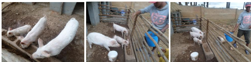
Les trois petits cochons Nif-Nif, Naf-Naf, Nouf-Nouf