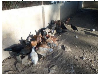
Poulailler et poulets